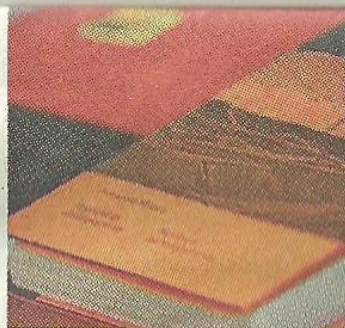
Il catalogo della mostra Ashes

tra i servizi fotografici finalisti del Poyi è impresa davvero eccezionale. La giuria, composta dai migliori esperti mondiali,