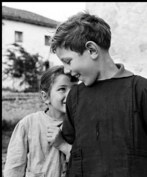
Fratelli - Castions di Zoppola 1959